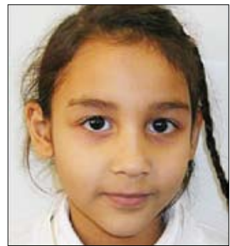
عير عمر بن ماضي