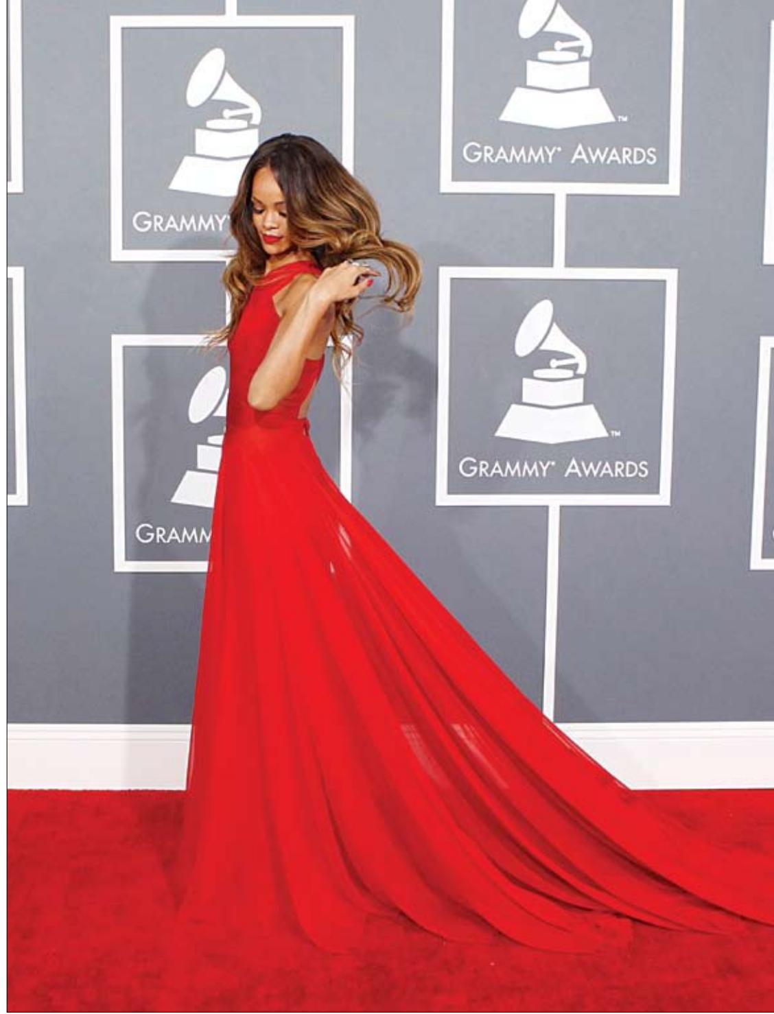
المغنية ريهانا لدى وصولها إلى حفل توزيع جوائز جرامي السنوية في لوس أنجلوس. (روبرتز)